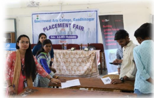
Our college placement team group photo: